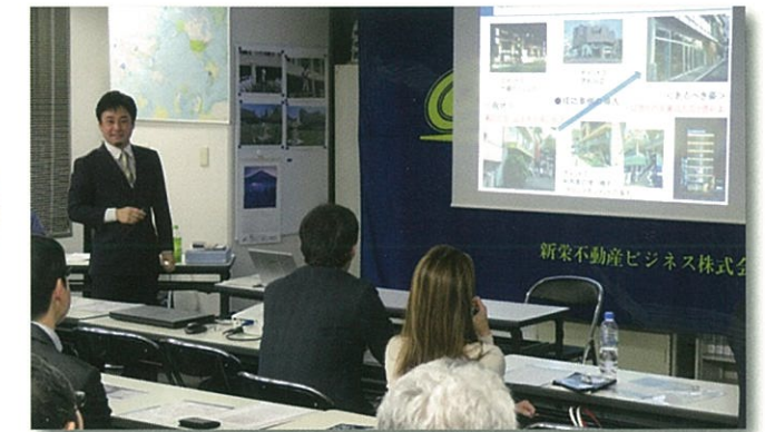
【本社オーナーズクラブ】

オーナー様を対象に、ビルメンテナンス及びテナント様とのトラブル解決法について弊社顧問弁護士による勉強会を開催中。 トラブル対応能力の向上に役立っています。