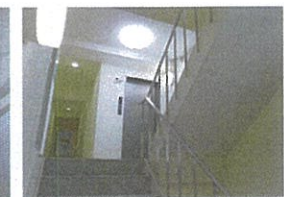
5Fエレベーターホール